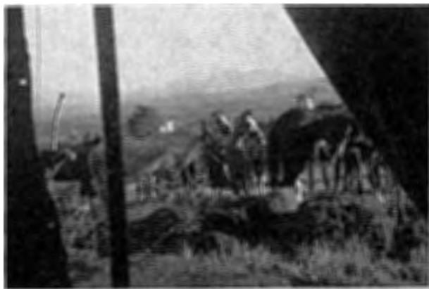
Utsikt från tältet

ning på bivacken. Tälten slogs några hundra meter upp på sluttningen i närheten av en plats, där det enligt uppgift skulle finnas en källa med gott dricksvatten. Krubbstrecken spändes mellan tjockstammiga sykomorträd som bredde ut sina väldiga kronor över en liten plåtå, från vilken vi hade en fascinerande vy över slätten upp mot Addis Abbeba.