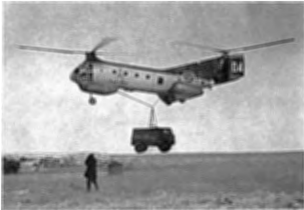
Bron sprängd! — Jeep efter jeep lyftes över vattendraget av helikoptern. — Spaningsplutonen fortsätter.

Vi livhusarer äro mycket entusiastiska för denna skvadron och se med full förtröstan framtiden an. Det är alltjämt fläkt över tjänsten, och trots att hästen är borta ha vi utmärkta möjligheter att vidmakthålla traditionell framåtanda och gälust.