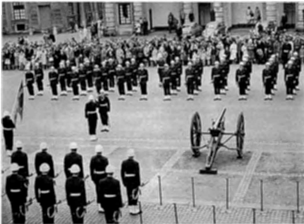
Livhusarna har under året bestridit ett antal högvakter vid Kungl. slottet och Drottningholm. Ovanstående fotografi visar 3. plut 5. skv under vaktavlösning den 31 maj.