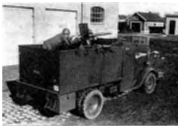
Pansarbil m/31. Ingick i pansarbilskvadron

Även om det ej ordades så mycket om förpliktande vapenslags- och regementstraditioner fanns förvisso känslan härav hos såväl befäl som meniga. Påfallande var de inkallade värnpliktigas tjänstvillighet och lystring till befälet. Man hade tydligen en känsla av att det var bäst att hålla ihop. En eventuell felande fick ej något medhåll hos sina kamrater och en tillsägelse togs med gott humör även om den var militärt kärv. Man satt ju alla i samma båt. Betydelsen av den fredstida mindre populära vapen- och stridsexercisen insåg man nu tydligt.