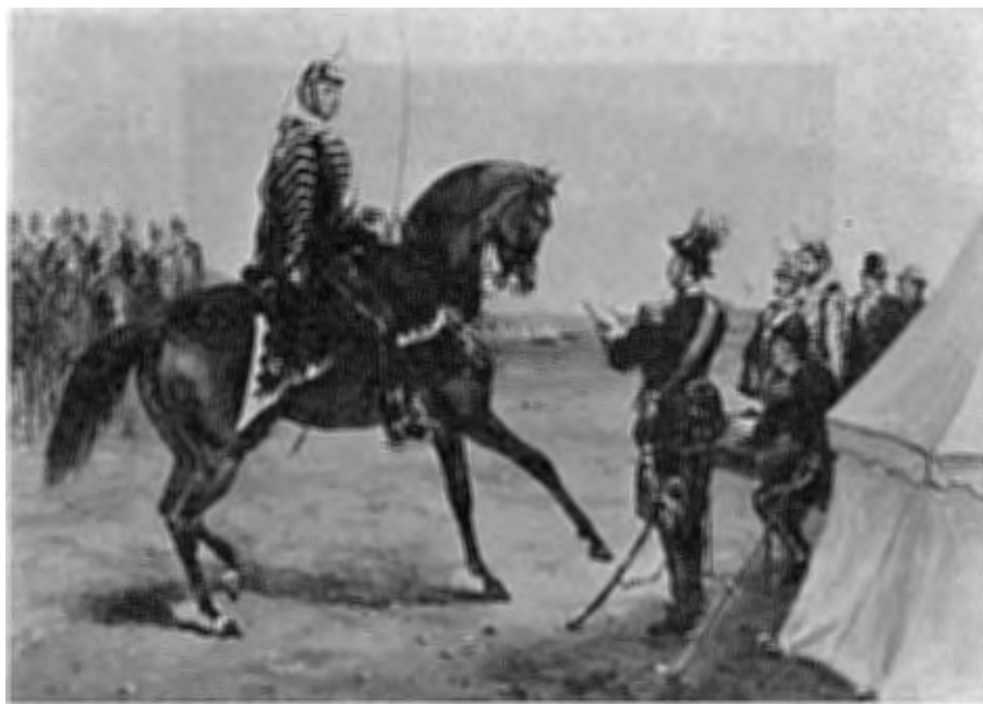
"Generalmönstring" under mitten av 1800-talet. Org. av J. Arsenius på officersmässen.

Vintern 1679 rekryterade Bielke c:a 500—600 man till Lifregementet för att fylla uppkomna vakanser. Då statskassan var hårt ansträngd var han tvungen att till stor del själv tillskjuta erforderliga medel.