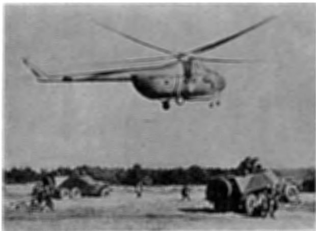
Hkp Mi-4 1 + 4 pers