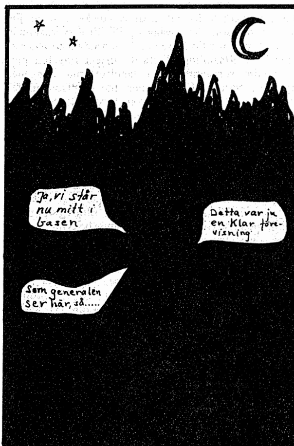
Militärbefälhavaren stiftar bekantskap med spaningsskvadronen.

På kvällen besökte vi en motorreparationsverkstad som fienden hade upprättat i vår närhet. Under första besöket kunde vi ganska lugnt promenera omkring i