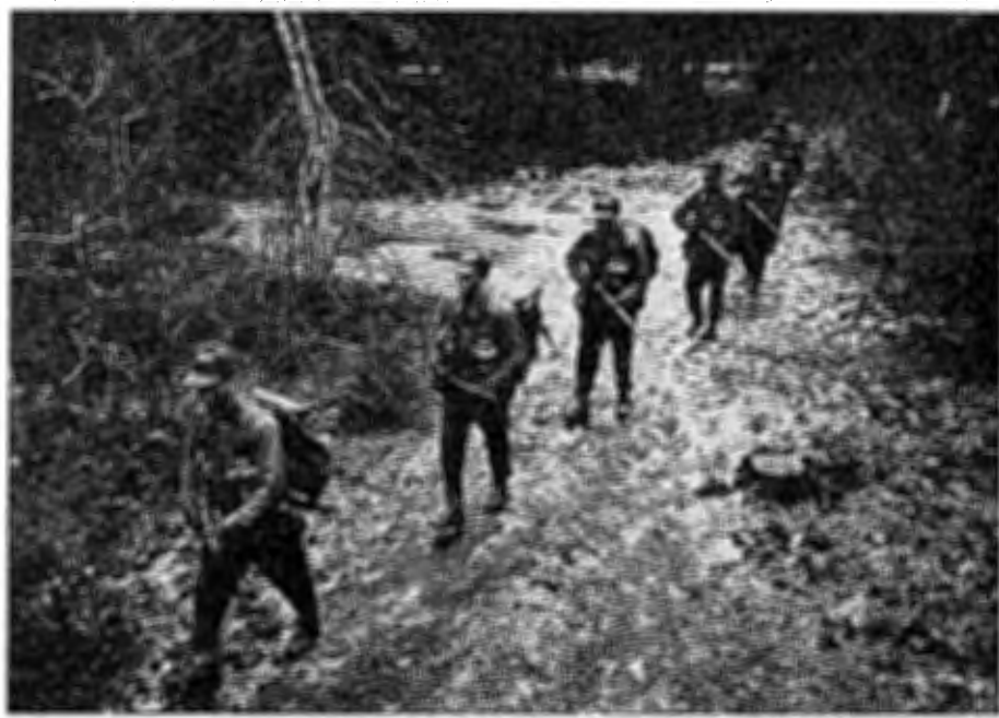
En spaningsgrupp på väg mot nya uppgifter.

DISCIPLIN — ORDNING — REDA — OMTANKE ger BRA SOLDATER vilka tillsammans kan bli EN BRA SPANINGSPLUTON .