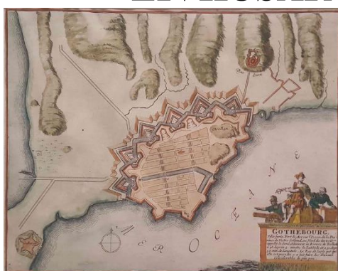
Göteborgs hamn 1600-talet